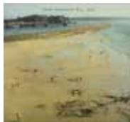
9. Spår, 2010