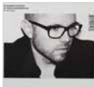
8. En sommar på speed, 2008