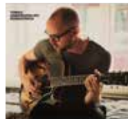
10. Romantiken, 2012